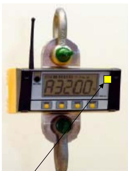
Ovjerni žig u obliku naljepnice